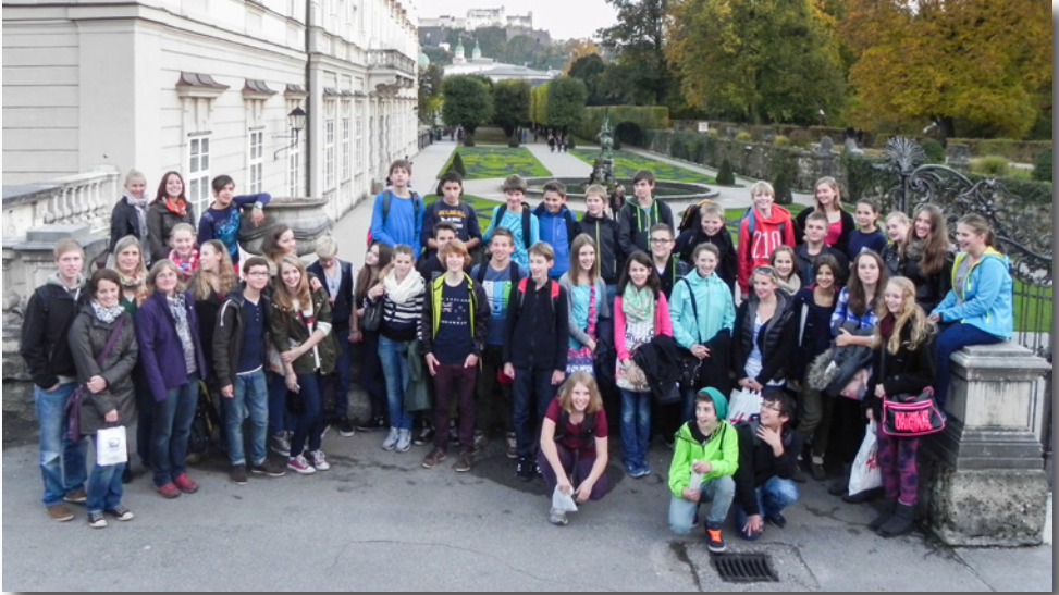
Firmausflug nach Salzburg