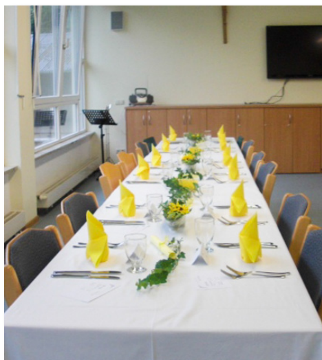
Die perfekt gedeckte Dinner-Tafel