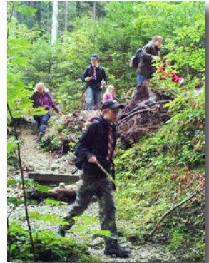
Unterwegs a. Blomberg

Für die Jüngsten (ab 4 Jahren) war die Fahrt mit dem Blomberg-Blitz, einer auf Schienen geführten Alpen-Achterbahn ein besonderes Erlebnis. Der Höhepunkt des Tages war für alle, ob Groß oder Klein, die Überquerung des Einbachs. Da die Brücke weggeschwemmt war, musste über Wurzeln und Schwemmholz geklettert, oder der Bach barfuß durchschritten werden.