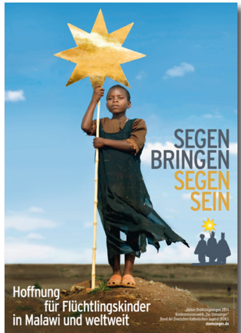
Das Plakat der diesjährigen Sternsingeraktion

„Segen bringen, Segen sein. Hoffnung für Flüchtlingskinder in Malawi und weltweit!“ heißt das Leitwort der 56. Aktion Dreikönigssingen, das aktuelle Beispielland ist Malawi. 1959 wurde die Aktion erstmals gestartet. Inzwischen ist das Dreikönigssingen die weltweit größte Solidaritätsaktion, bei der sich Kinder für Kinder in Not engagieren. Sie wird getragen vom Kindermissionswerk „Die Sternsinger“ und vom Bund der Deutschen Katholischen Jugend (BDKJ). Jährlich können mit den Mitteln aus der