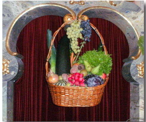
Erntekorb in St. Erhard

Die Bewahrung der Schöpfung – diesem Leitgedanken fühlen sich