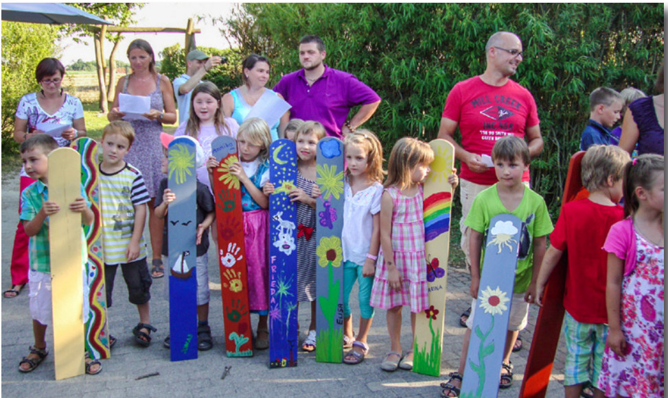
Die Kinder von St. Peter präsentieren ihre wunderschön bemalten Zaunlatten

Das schönste Geschenk, das unser Haus bekommen hat, kann nun jeder, der bei uns vorbeispaziert, bewundern. Jedes Kind hat zur Erinnerung eine Zaunlatte bemalt, die nun unseren Gartenzaun verziert! Vielen Dank liebe Schulanfänger 2013!