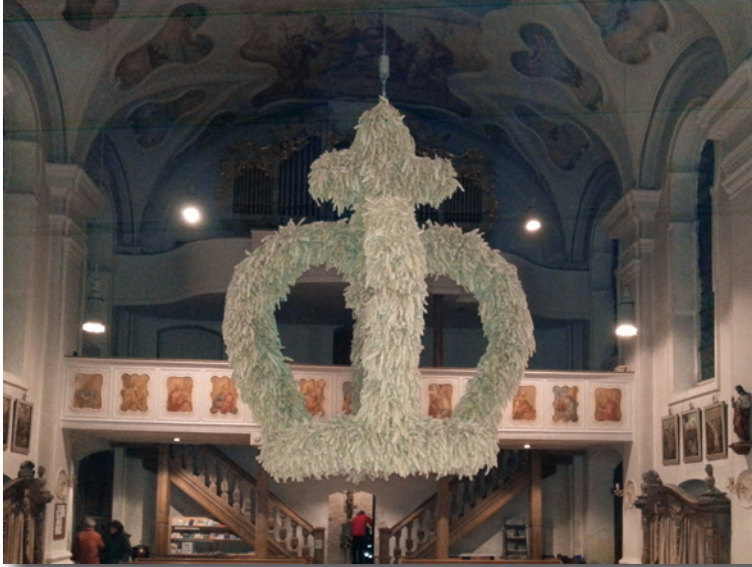
Die Erntekrone in der Pfarrkirche St. Peter, Wörth