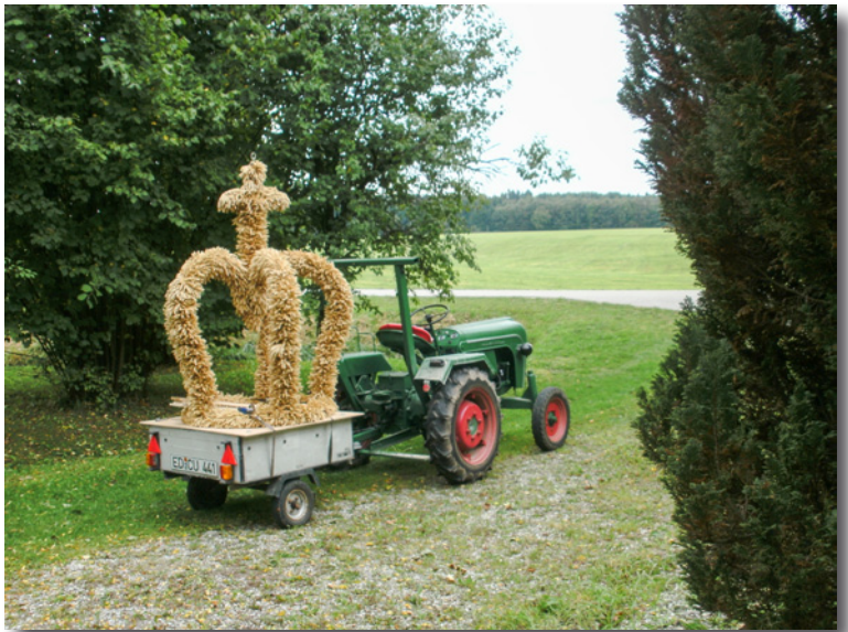
Die Walpertskirchner Erntekrone auf dem Weg in die Kirche