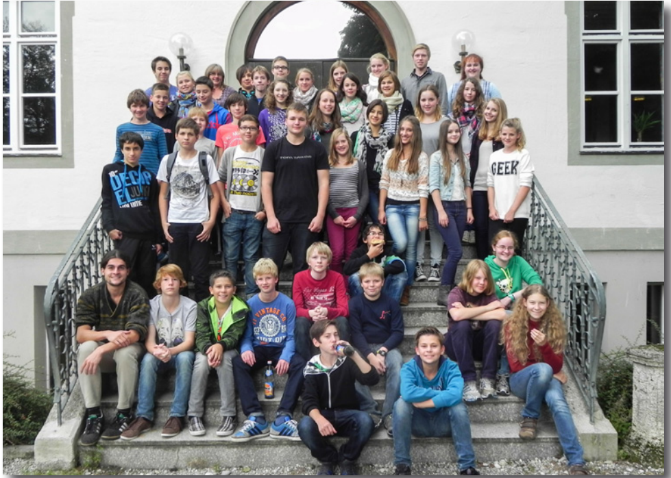
Gemeinsamer Aktionstag in Benediktbeuern

Die Firmlinge wurden von folgenden GruppenleiterInnen in vier Gruppen auf die Firmung vorbereitet: