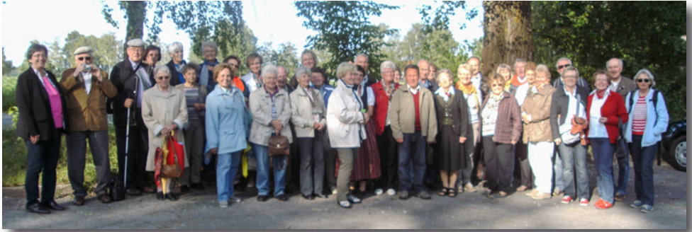
Die aktiven Helfer der Nachbarschaftshilfe Walpertskirchen in St. Ottilien

Die Nachbarschaftshilfe Walpertskirchen wünscht allen Mitgliedern des neuen Pfarrverbandes eine besinnliche Adventszeit, gesegnete Weihnachten und ein gesundes und glückliches neues Jahr!