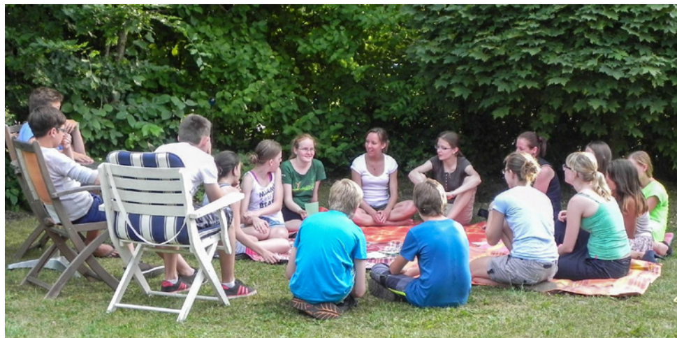
Gruppenstunde der KLJB Hörlkofen mit den diesjährigen Firmlingen