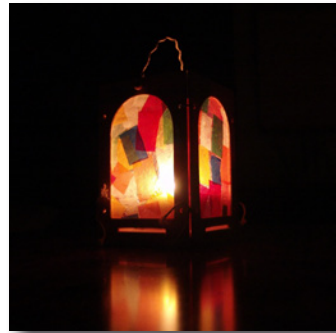
Die Laterne ist das unverzichtbare Utensil jedes Martinsumzuges

Der Martinstag am 11. November (in Altbayern und Österreich auch