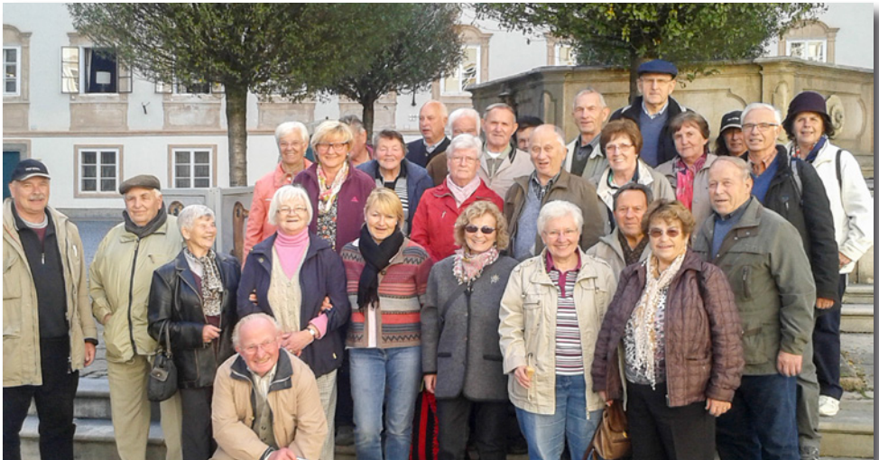
Die Walpertskirchner Senioren in Salzburg