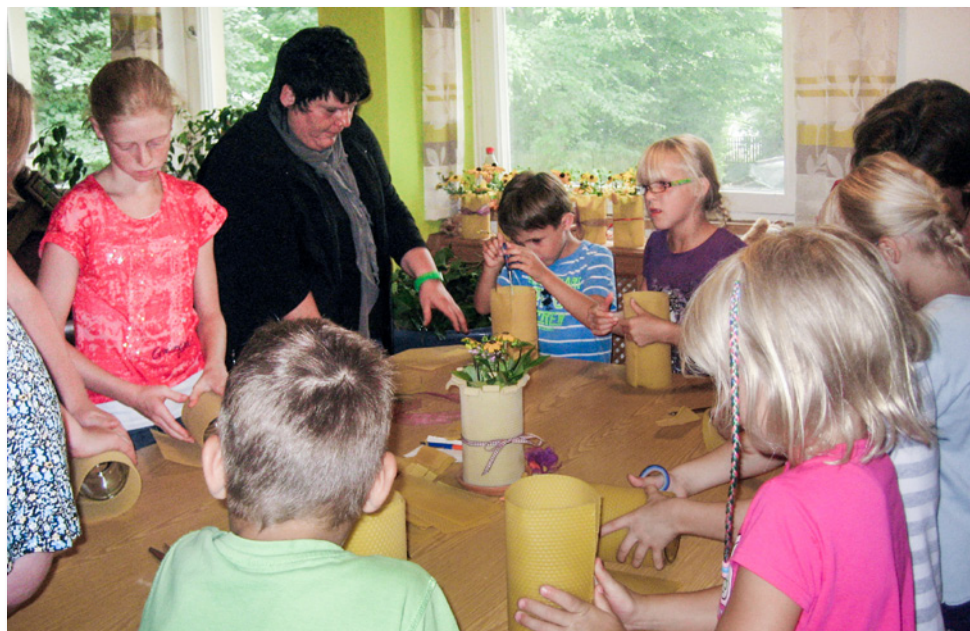
Beim Basteln von Bienenwabenvasen