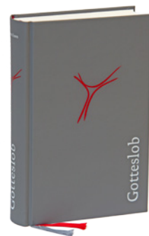
Das neue Gotteslob

Insgesamt ist das neue Gotteslob eine gelungene Sache. Wer darauf