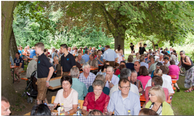
Beim Mittagstisch im Pfarrgarten Walpertskirchen Bild: J. Meier

Mitarbeiter vom „Eine-Welt-Laden“ boten beim Pfarrfest ihre fair- gehandelten Produkte an. Bild: J. Meier