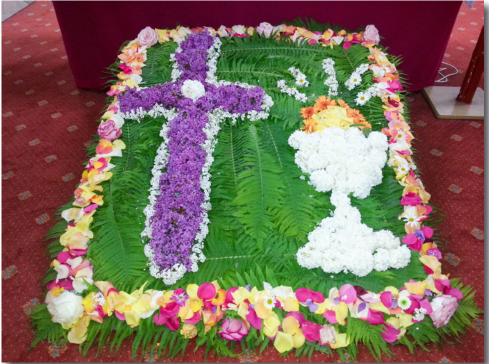
Der Blument Teppich, der die Wörther Kirche zusätzlich prächtig schmückte, gestaltet von den Erstkommunionkindern