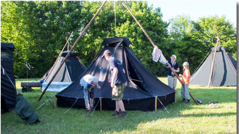
Im Pfingstlager der VCP-Region Isar in Landshut