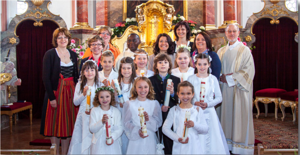
Erstkommunion in Walpertskirchen am 28.04.2013