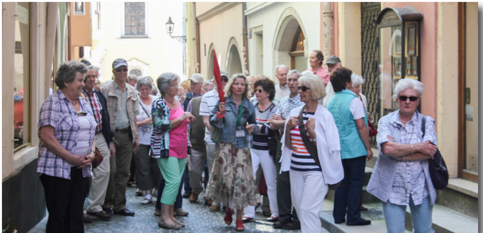
Stadtführung in der Regensburger Altstadt