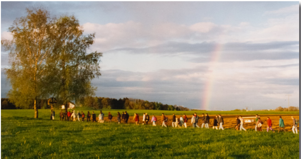
Auf dem Weg nach Tuntenhausen

Bedanken möchten wir uns auch für das Begleitfahrzeug und dessen Fahrer, der unserem Trupp hinterherfuhr und unser Gepäck abnahm, die Getränke und auch mal einen „Fußkran-