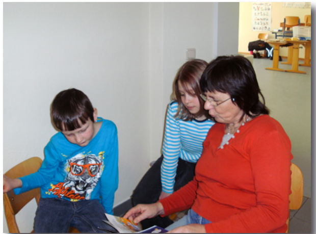
Ein Lesepate beim Vorlesen