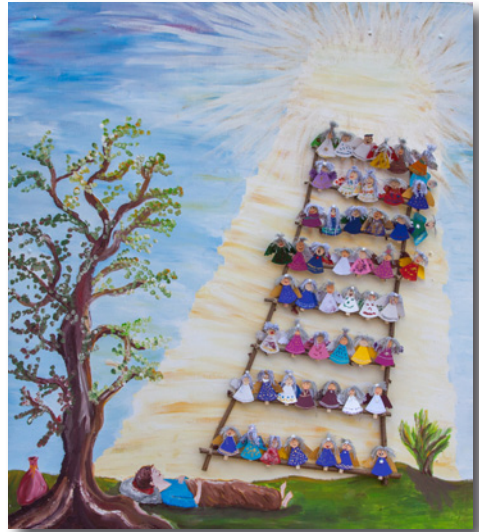
Jakob träumt von der Himmelsleiter