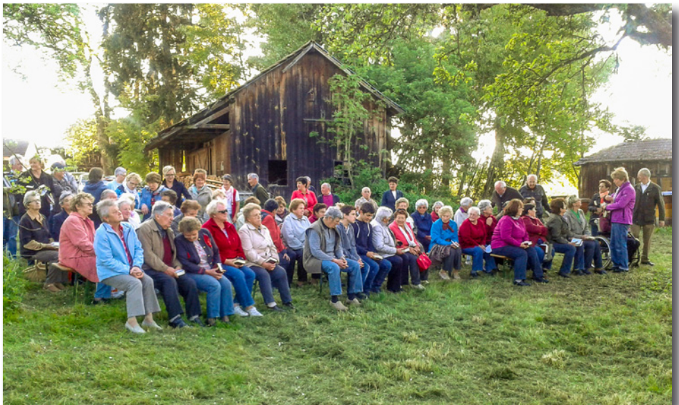
Besucher der Maiandacht in Rottmann