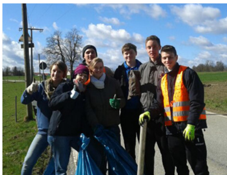
Mitglieder der KLJB Walpertskirchen beim „Ramadama“

Am 13. April 2013 rief die Gemeinde Walpertskirchen alle Vereine zur Ramadama-Aktion auf. Die Landjugend Walpertskirchen engagierte sich dabei mit einer großen Teilnehmerzahl und räumte in der Gemeinde fleißig auf.