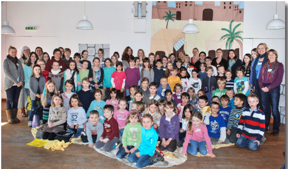
Die Teilnehmer an den Kinderbibeltagen in Wörth