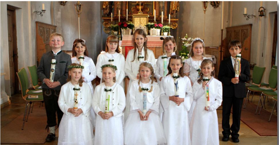
Erstkommunion in Hörlkofen am 09.05.2013