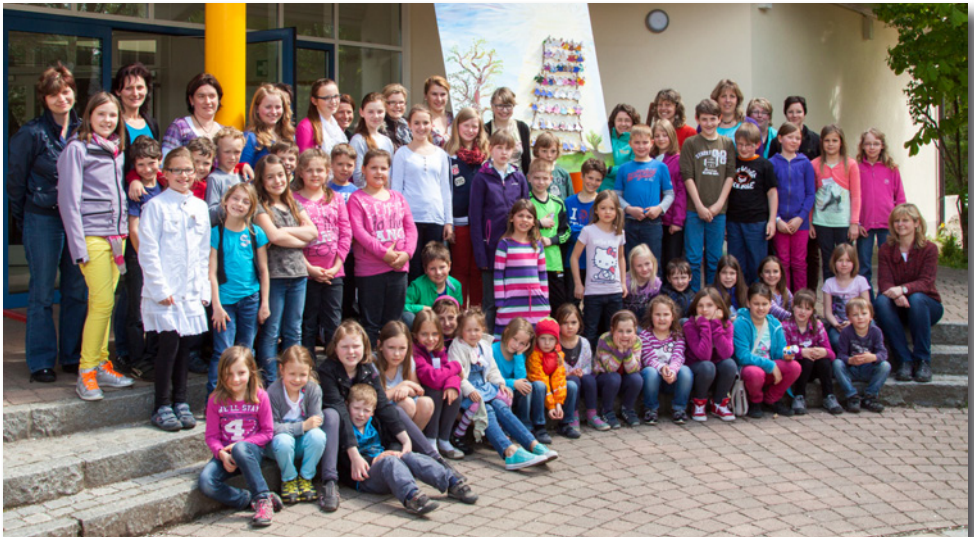
Alle Teilnehmer am Kinderbibeltag in Walpertskirchen