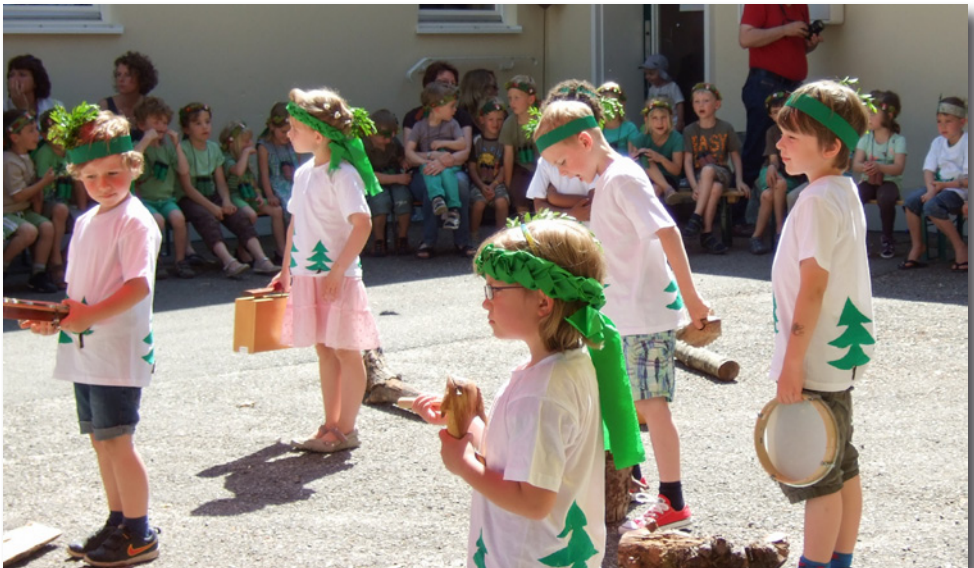
Die Aufführungen der Kindergartenkinder wurden mit viel Applaus belohnt