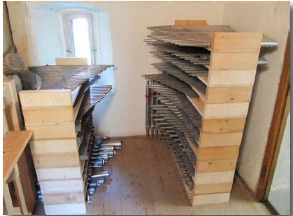
Die während der Renovierung ausgebauten Pfeifen.

Die Orgel ist sehr vielen Einflüssen ausgesetzt. So ist sie neben Kälte, Wärme vor allem einer hohen Luftfeuchtigkeit ausgesetzt. Dies trägt natürlich immer dazu bei, dass sich nicht nur viel Schmutz innerhalb der Orgel festsetzt, sondern sie auch verstimmt. Die Anschaffung der Orgel erfolgte 1983 kostenbewusst, so dass nun eine sehr gründliche Überarbeitung notwendig wurde. Alle 1344 Orgelpfeifen mussten ausgebaut, entstaubt