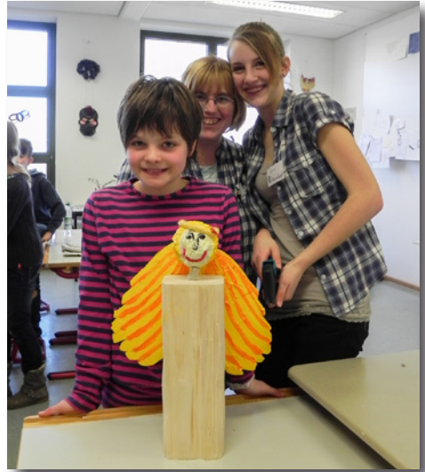
Stolz präsentiert ein Kind seinen gebastelten Engel

Danke an dieser Stelle an die Bäckerei Schauer für die Brezen- und den Fendsbacher Hof für die Holz-