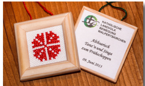
Die Tanzzeichen zum Altboarisch Tanz´n und Singa