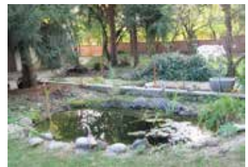
Garten der Tagesstätte

Psychische Gesundheit ist eine Art Idealzustand, in dem das Leben Freude macht auch wenn es Belastungen mit sich bringt. Wenn diese aber zu groß werden, dann kann die Seele aus dem Gleichgewicht geraten. Dann fehlt nur noch ein Tropfen und das Fass kommt zum Überlaufen - die Seele reagiert mit Trauer und Verzweiflung, mit wahnhaften Gedanken und mit unerklärlichen Ängsten – sie ist krank geworden. Der Mensch wird unsicher, zieht sich zurück und traut sich nichts mehr zu.