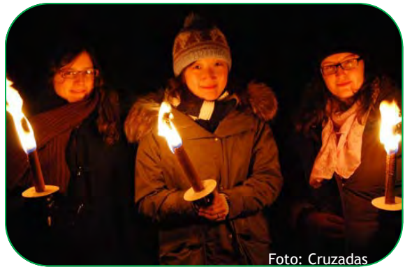
Foto: Cruzadas Studentinnen bei unseren Kar- und Ostertagen