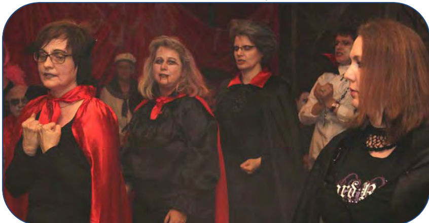
▼ Tanzperformance des Auftakt-Chors

Noch bis 2 Uhr feierten die Faschingsbegeisterten des Pfarrverbands Pasing gemeinsam weiter.