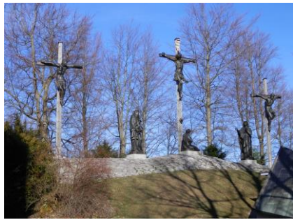
Gemeinsam auf dem Pilgerweg zum Kalvarienberg