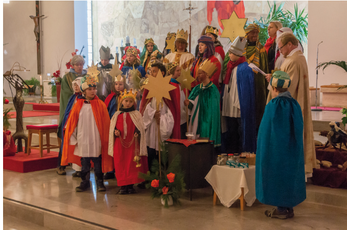
Aussendungsgottesdienst in St. Benedikt, Ebenhausen am 6. Januar 2014

Überall auf der Welt gibt es Menschen, die aufgrund von Krieg oder Hungersnöten aus ihrem Heimatland fliehen müssen. Weltweit sind insgesamt 45,5 Millionen Menschen auf der Flucht, darunter etliche Kinder. Viele von ihnen kennen nur das Leben in den Flüchtlingslagern. In der Bayernkaserne in München leben derzeit viele jugendliche Flüchtlinge, es wird jedoch dringend nach neuen Unterkünften gesucht. Täglich berichten die Medien von neuen Schicksalen... Die Sternsinger in unserem zukünftigen Pfarrverband haben Anfang des Jahres bewiesen, dass sie hier helfen wollen. Mit dem Neujahrsegen, den sie in die Häuser brachten, haben sie auf das Flüchtlingsthema aufmerksam gemacht und 14.040,49 € an Spenden gesammelt. Mit diesem Geld werden Hilfsprojekte in Flüchtlingslagern unterstützt, die ausschließlich Kindern zugutekommen: Hilfe für Waisen, Ausstattungen von Kinderkrankenhäusern, Gelder für Lehrer und Schulen, damit auch im Lager Unterricht möglich ist und Bildung gefördert wird. Zwischen Baierbrunn und Icking waren 108 Kinder und Jugendliche unterwegs. Ihnen allen herzlichen Dank für diesen großartigen Einsatz!