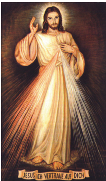
Bild in der Alten Ickinger Kirche

Das Original dieses Gnadenbildes befindet sich im Karmel in Krakau. Wasser und Blut entströmt dem Herzen Jesu; das Wasser der Taufe, das Blut der Erlösung. Es beruht auf einer Vision der polnischen Ordensschwester Faustyna Kowalska (1905-1938). Sie wurde am Sonntag nach Ostern des Jahres 2000 von Papst Johannes Paul II heilig gesprochen. Papst Johannes Paul II verehrte dieses Bild in besonderer Weise.