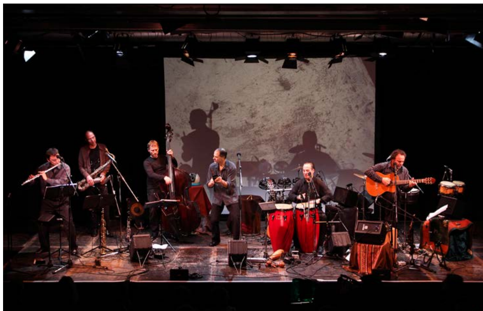
Grupo Sal, eine internationale Combo aus Chile, Argentinien, Portugal und Deutschland

Weitere Infos zur Konzertlesung in München auf der nächsten Seite!