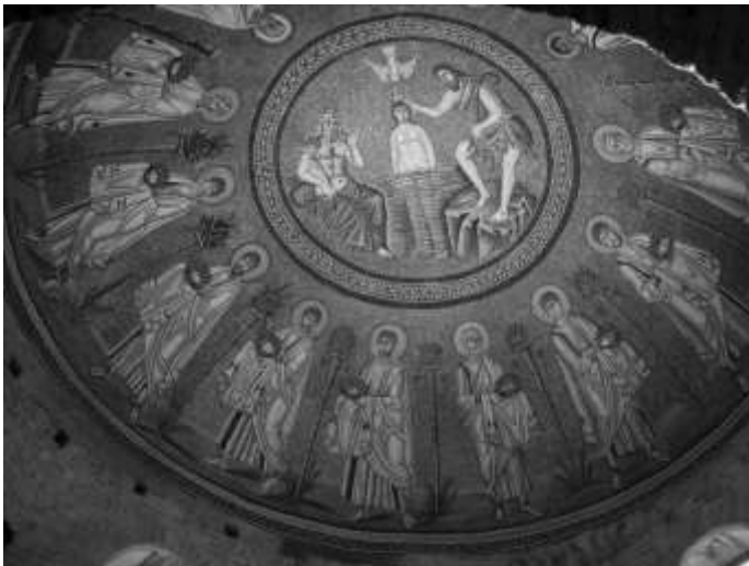
Palmen zwischen den Aposteln im Baptisterium der Arianer in Ravenna

Einen netten Hinweis auf die Palme als lebensspendenden Baum finden wir im apokryphen Pseudo-Matthäusevangelium: Auf Bitte des Jesuskindes beugt sich eine Palme herab, um die heilige Familie auf ihrer Flucht nach Ägypten mit ihren Datteln zu verköstigen und zwischen den Wurzeln der Palme sprudelt eine Quelle hervor, um den Durst der heiligen Familie zu löschen.