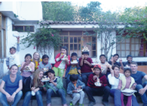
Die Kinder haben Hexenhäuschen gebastelt