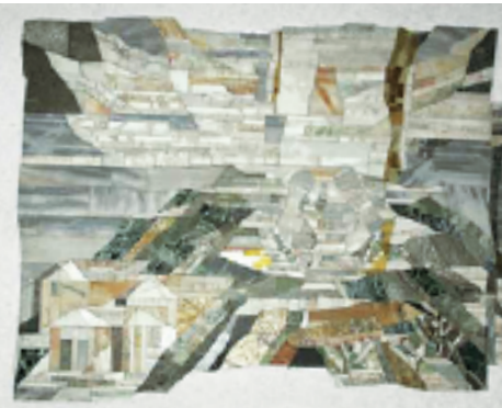
Erste Kreuzwegstation in Verklärung Christi