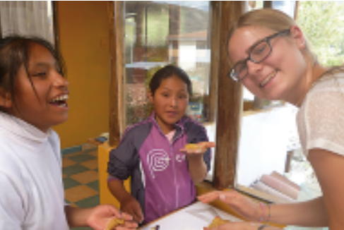
Plätzchen backen in der Weihnachtszeit