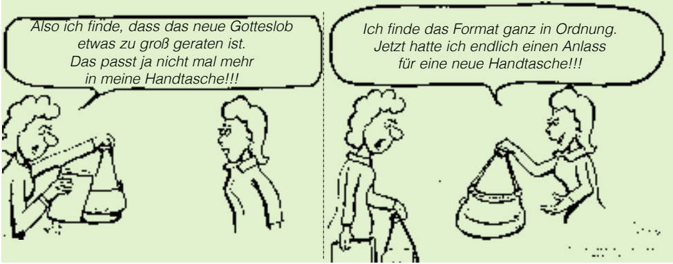
Cartoon ©Ulrich Wörner, www.UliCartoons.de