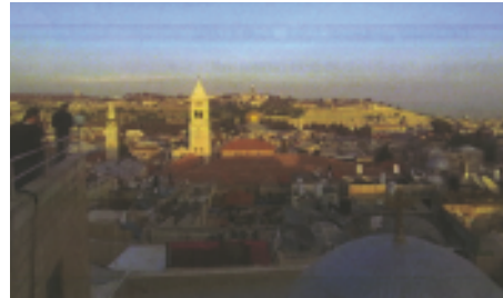
Blick vom Dach des Patriarchen der Melkitisch-Kath. Kirche

In Jerusalem existiert ein Konglomerat von Religions- und Weltauffassungen, auch innerhalb der vielen christlichen Konfessionen, die hier vertreten sind. Die wöchentlichen freien Tage sind je nach Religion Freitag, Samstag oder Sonntag. Weil die Juden, religiös oder nicht, die vorherrschende Kraft sind, fahren z. B. am Sabbat keine öffentlichen Verkehrsmittel. Dann treffen sich die Juden in zahllosen Gruppen in den Parks der Stadt, vor allem viele junge Familien.