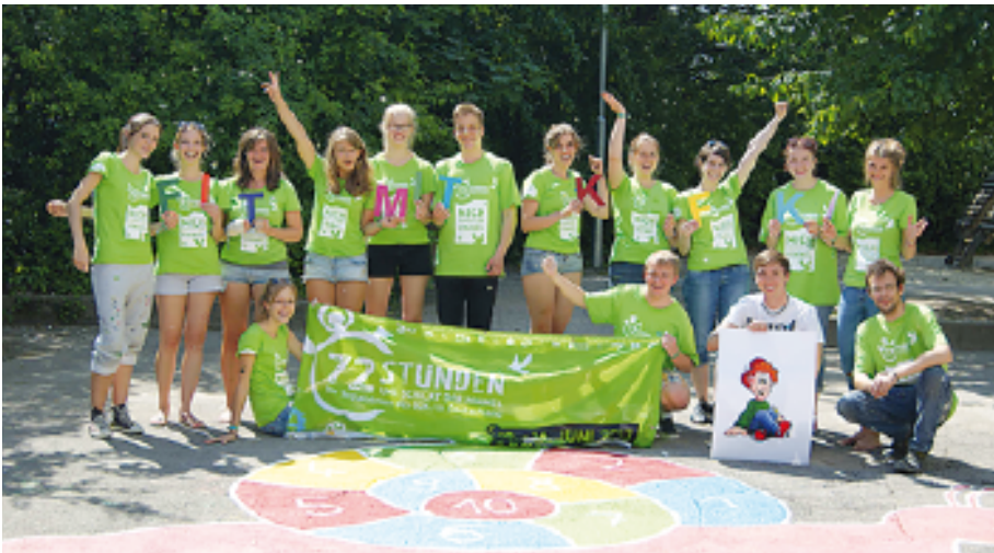
Jugendleiter und Anwärter während der 72-Stunden Aktion „Uns schickt der Himmel“