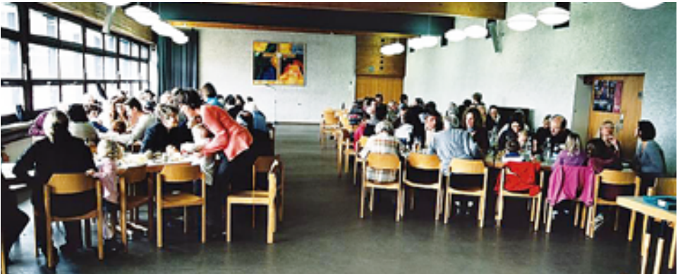
Alt und Jung finden sich im Pfarrsaal zum Gemeinsamen Mittagstisch und zu Gesprächen

Eng verbunden ist die Verklärungsgeschichte von daher mit der Passion, der Fastenzeit. So wird das Evangelium von der Verklärung stets am zweiten Fastensonntag verkündet. Das eigentliche Patrozinium fällt auf den 6. August und wird auch in unserer Pfarrei an diesem Tag mit einem Gottesdienst gefeiert.