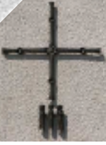
Das Außenkreuz an der Ostseite von VC