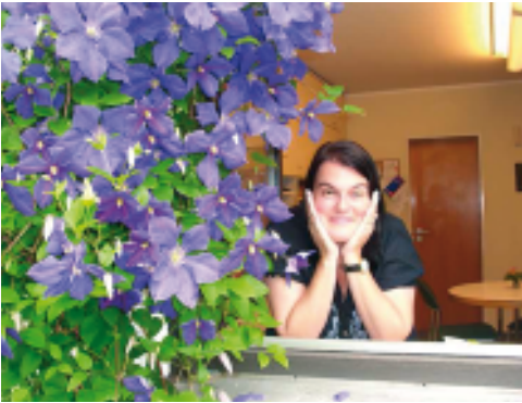
Diesen Anblick werden wir vermissen

seit vielen Jahren bist Du die gute Seele im Büro von Verklärung Christi, erst in der Buchhaltung, dann später auch als Pfarrsekretärin.