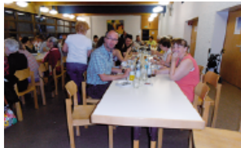
„Komm her, freu dich mit uns!“ Spiele, esse, singe, tanze, lache ... mit uns!

Natürlich wird auch ein gemeinsames Abendessen vorbereitet! Nähere Informationen zu den Angeboten finden Sie rechtzeitig vor der VC-Nacht in den Schaukästen und aufliegenden Handzetteln.