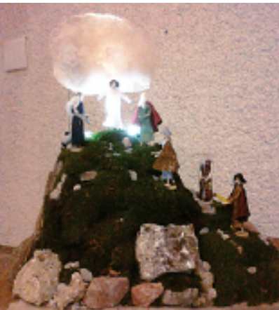
Darstellung entstand 2010

– Im Inneren findet sich an der südlichen Wand der von Bruder Benedict Schmitz in den Jahren 1981/1982 entworfene Passions-Zyklus. Dieser als Naturstein-Mosaik gestaltete Kreuzweg beginnt im Gegensatz zu üblichen Kreuzwegdarstellungen mit der Verklärungsszene. Zu sehen ist deutlich der Berg und eine strahlende Helligkeit, die von oben in Gold- und Weißtönen hereinbricht. Am linken Bildrand stehen die Hütten, die die Jünger nicht bauen durften. In der Bildmitte sind Fußspuren, die nach unten zeigen und deutlich machen, dass der Weg wieder hinunter führt, ins Tal, nach Jerusalem, nach Golgotha.