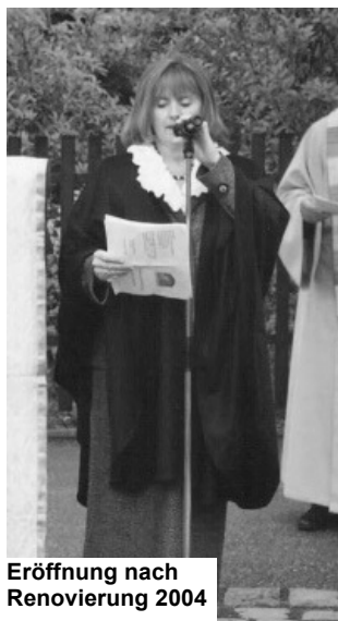
Eröffnung nach Renovierung 2004