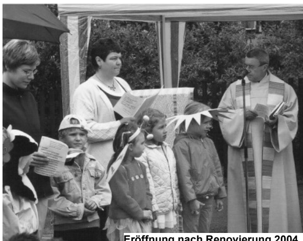
Eröffnung nach Renovierung 2004