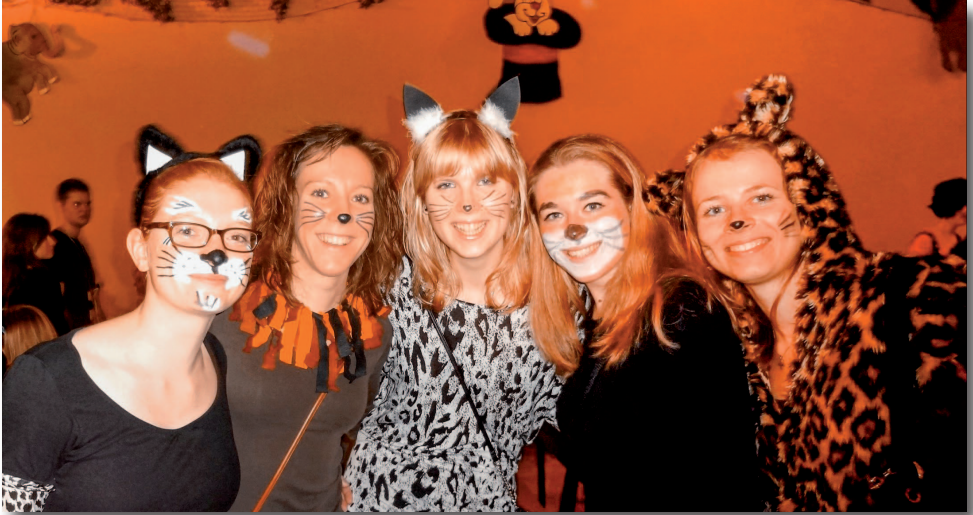
„Tierisch was los“ ist bei der KLJB Hörlkofen