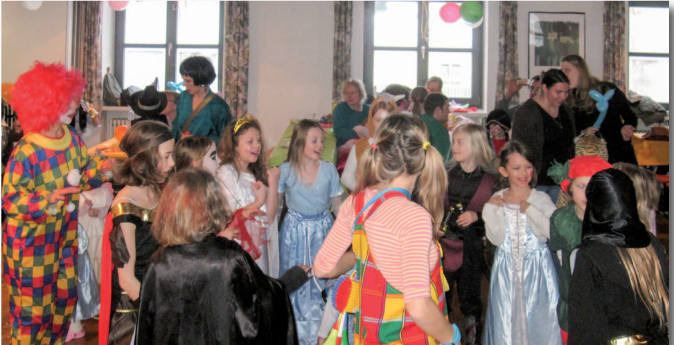
Fasching im Kindergarten Wörth