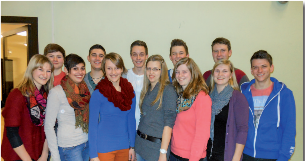
Die neue Vorstandschaft der KLJB Walpertskirchen