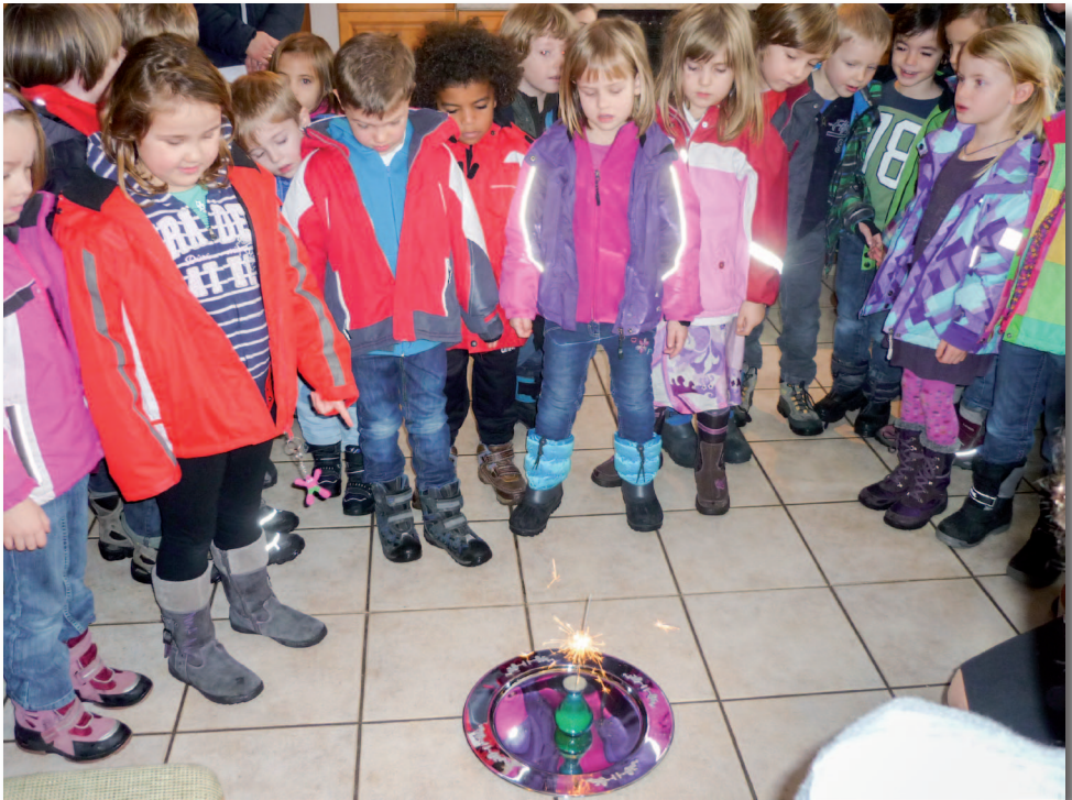
Die Kinder des Kindergartens Walpertskirchen zünden die Wunschrakete