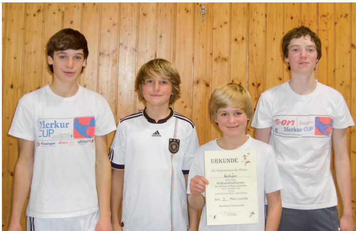
Die erfolgreiche Mini-Mannschaft aus Hörlkofen