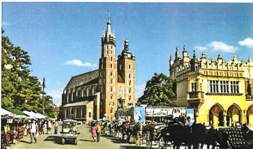
Marienkirche in Krakau