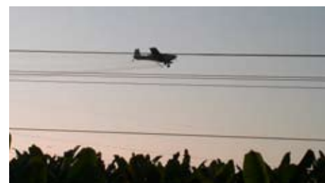
Flugzeug sprüht Spritzmittel über die Plantage.

prüfung gewisser Standards bei den Lieferanten. Die Wirklichkeit sieht aber anders aus. Erst wenn die Preispolitik in Deutschland weg vom Billigangebot kommt, erst dann ist es in den Lieferländern möglich die sozialen Standards einzuhalten. Oxfam stellt fest, dass der Bananenpreis nicht den Marktgesetzen unterliegt – Aldi macht den Preis, und