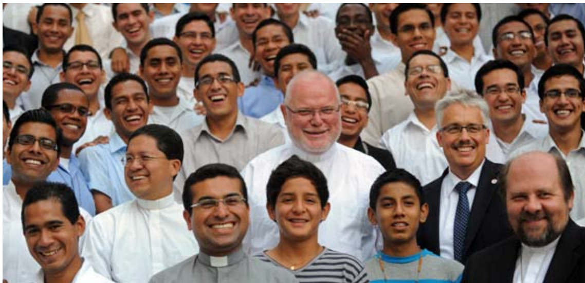
Kardinal Marx, Prof. Tremmel und Weihbischof Bischof inmitten von Priesterseminaristen in Guayaquil, September 2012

Mons. Stehle erhält Statue Artikel geben Einblick in das Leben von Bischof Stehle, dem eine Statue in Santo Domingo gewidmet wurde Seite 10