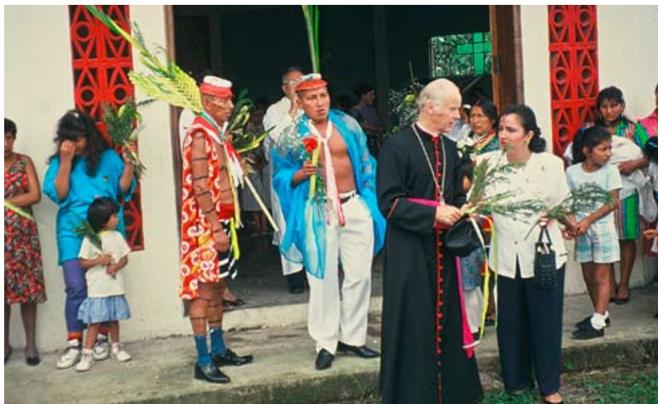
Bischof Stehle suchte in seiner Diözese Santo Domingo stets die Nähe zu den Indigenas

Er beeinflusste Prozesse des Friedens und der Versöhnung in unserem Lateinamerika. Davon geben Zeugnis: Ehrendokortitel, internationale Anerkennungen und der Vorschlag für den Friedens-Nobel-Preis. In seinem hohen Alter empfängt er nun in seiner Heimat Deutschland die Ehrung eines dank-