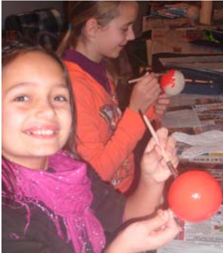
Malspaß mit den Holzkugeln