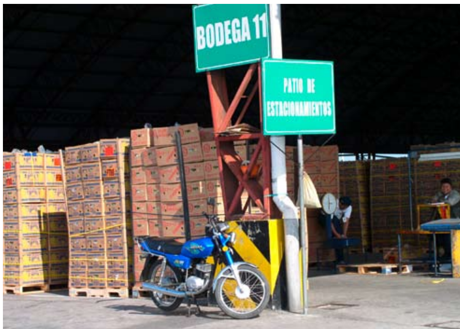
Die Bananen stehen im Bananenhafen in Machala zur Verschiffung bereit

Geben Sie uns ihre Termine bekannt, dann können wir sie gerne hier veröffentlichen!