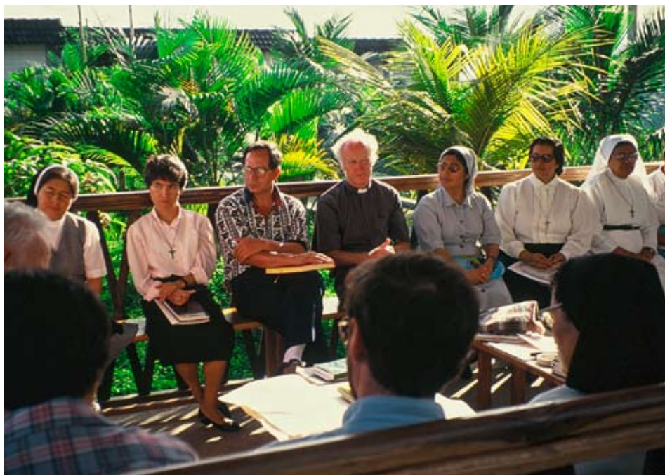
Bischof Stehle mit seinen Mitarbeitern in seiner Diözese