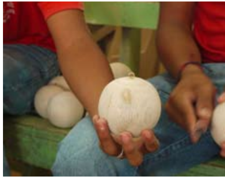
In Puyo wurden die Kugeln angefertigt