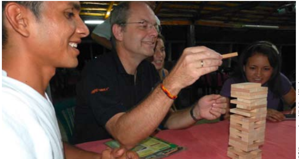
Jugendlicher im Spiel mit einem Kolping-Delegationsmitglied

Und noch etwas überrascht mich immer wieder: wie ähnlich im Grunde die Schwierigkeiten sind, die wir hier und die Menschen dort haben: Ein Jugendlicher, der im Kolpinghaus in Portoviejo Unterkunft und Ausbildung bekommt, berichtete uns, wie er bisher durch Familienangehörige und Mitglieder des Dorfes so drangsaliiert wurde, bis er selbst von sich glaubte, dass er nichts wert sei und auch beruflich zu nichts taugt. Erst im Kolpinghaus hat er Menschen gefunden, die ihm zeigen konnten, dass er etwas kann und somit auch einen Wert für sich und die Gesellschaft hat. Und ich dachte dabei an manchen Jugendlichen bei uns in unseren Ausbildungsmaßnahmen.