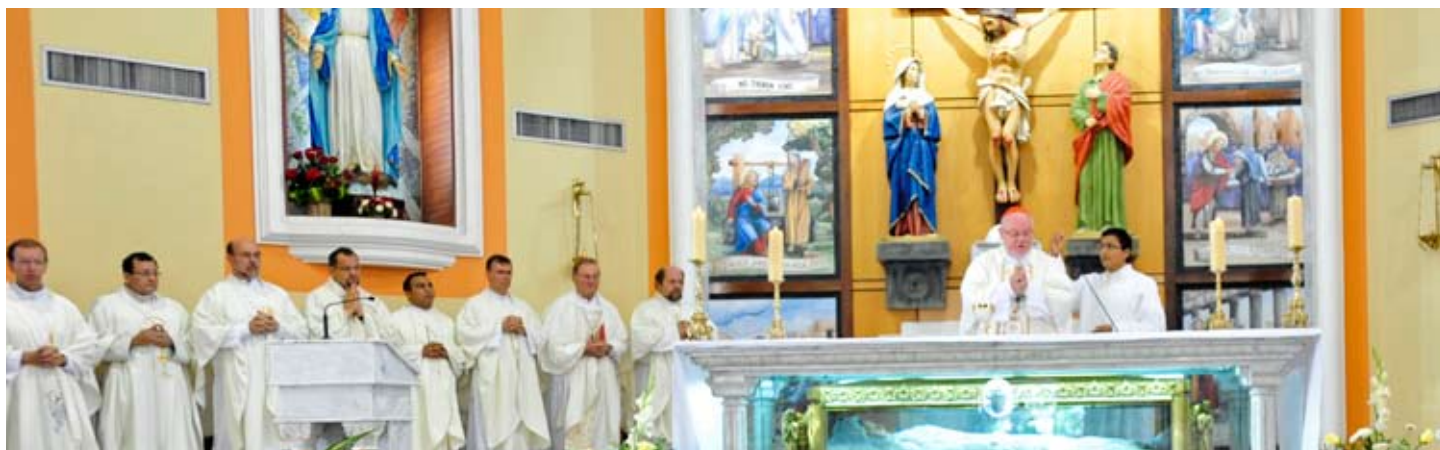
Hauptzelebrant Kardinal Marx am Wallfahrtsort „Nobol“ der Heiligen „Narcisa de Jesus“