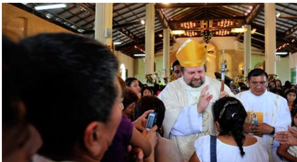
Weihbischof Bischof nach der Messe mit Einweihung der Kirche „Progreso“ und des Altares