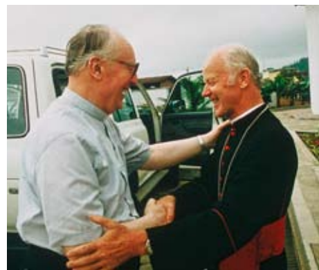
Bischof Stehle (re.) mit Kardinal Wetter auf einem seiner Besuche in Ecuador

Staatengemeinschaft in einen Fonds einzahlt. Es gibt aber Berichte, dass längst Erdöl gefördert wird. Wie ist die Position der Kirche in diesem Punkt?