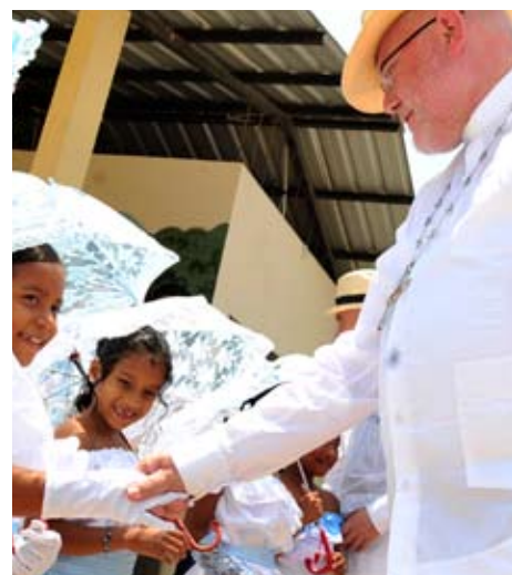
Kardinal Marx bei einer Schülerpräsentation