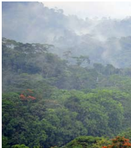
Der Urwald hier bei Puyo gilt als absolut schützenswertes Reservat der Biodiversität

Die Bananenmultis wie Dole-Ubesa, Reybanpac (Marke Favorita) und Noboa (Marke Bonita) treten die Arbeiterrechte regelrecht mit den Füßen: Überstunden werden nicht bezahlt, Sozialleistungen