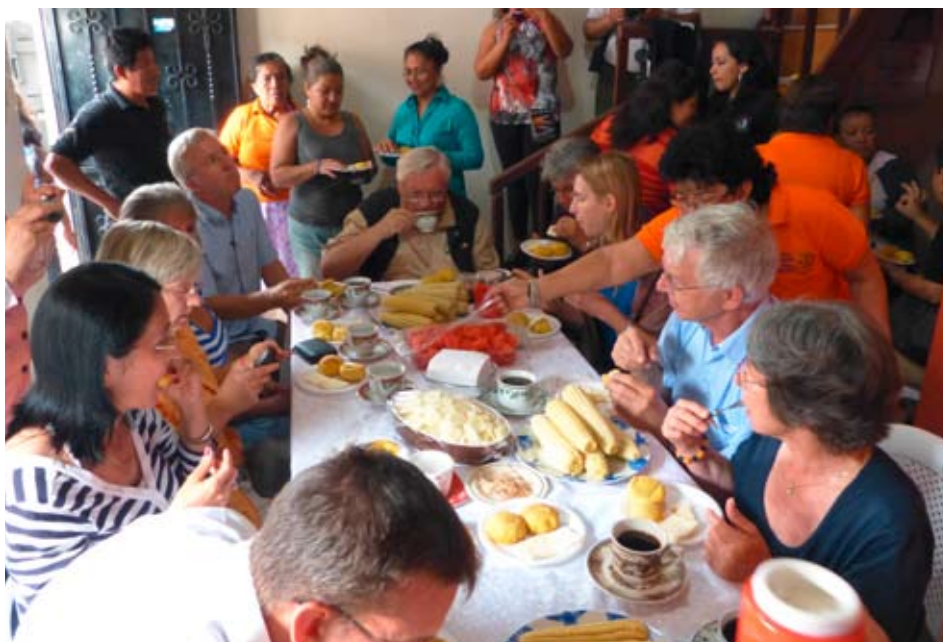
Gastfreundschaftliche Szene: Kolpingdelegation zu Besuch bei Freunden

Hier kommen Sie auf die Seite der internationalen Arbeit des Diözesanverbands