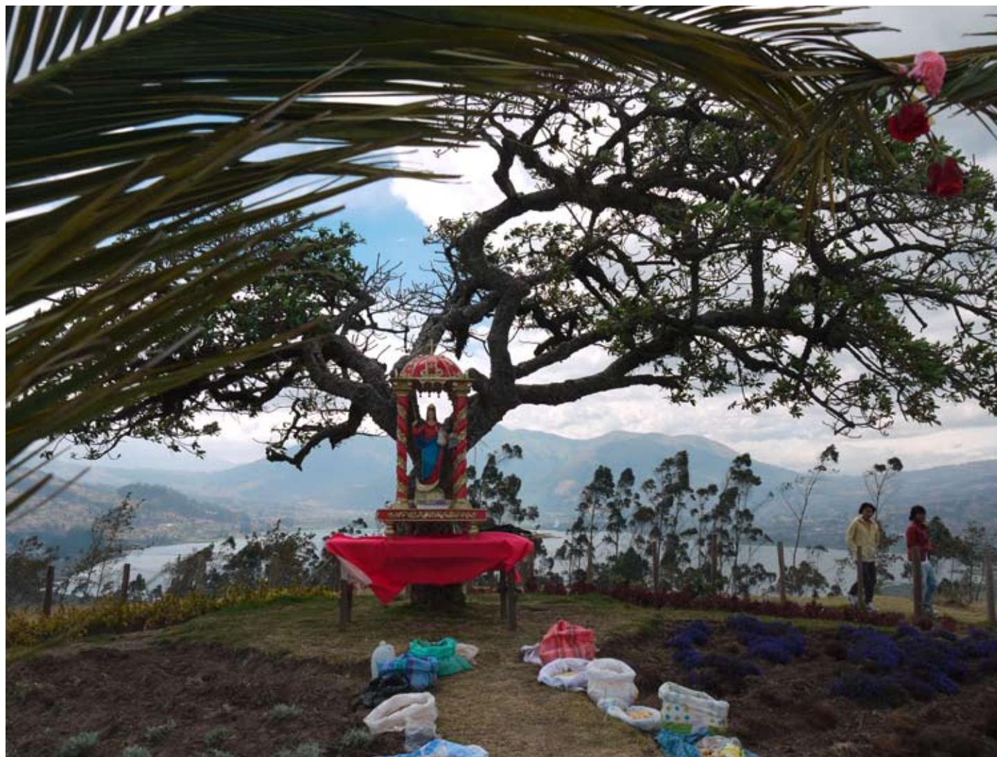
Das Gastgeschenk unterwegs in Ecuador: die Patrona Bavariae an der alten Kultstätte der Indigenas „El Lechero“ am Lago San Pablo, Diözese Ibarra