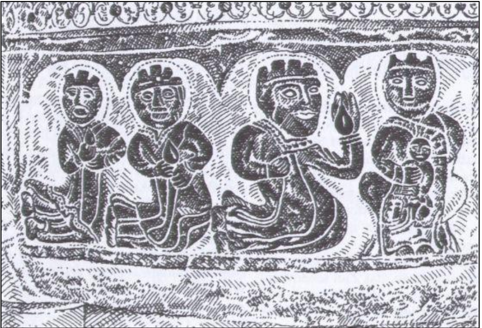
Anbetung der Könige in der Pfarrkirche St. Peter und Paul in Straelen / Niederrhein (12. Jh.)