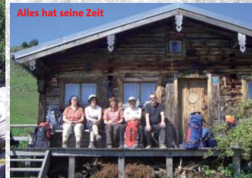
Alles hat seine Zeit

Eindrücke von den Hütten-Exerzitien beim hinteren Sonnwendjoch im Juni 2010: »Unterwegs mit dem Buch Kohelet«