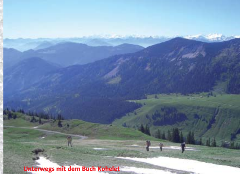
Unterwegs mit dem Buch Kohelet