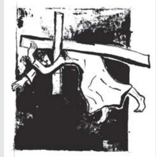
Der erste Fall