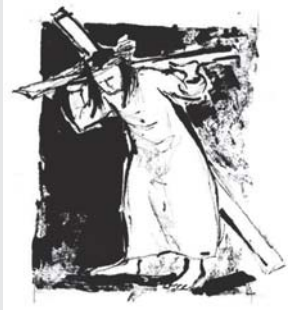
Jesus nimmt das Kreuz auf sich