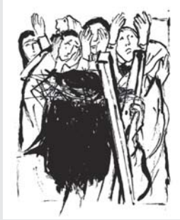
Begegnung mit den weinenden Frauen