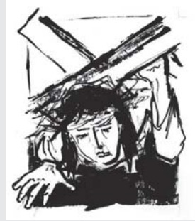
Der dritte Fall