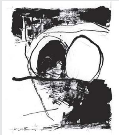
Jesus wird ins Grab gelegt