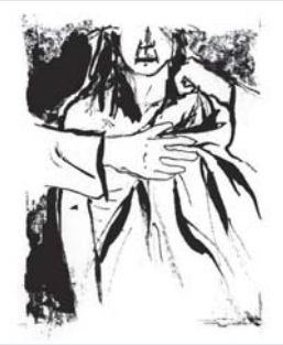
Jesus wird seiner Kleider beraubt