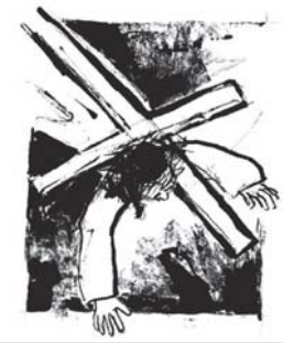
Der zweite Fall