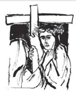
Begegnung mit der Mutter