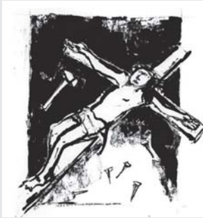
Jesus wird ans Kreuz geschlagen