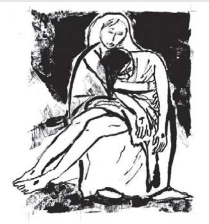
Jesus wird vom Kreuz genommen