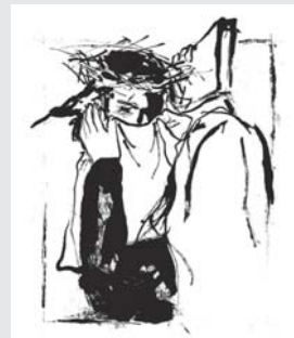
Jesus und Veronika