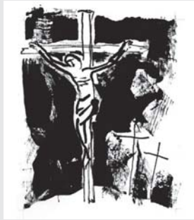
Jesus stirbt am Kreuz