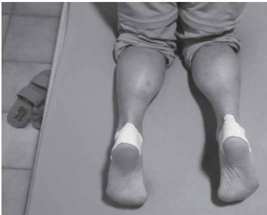
Auch so kann Pilgern aussehen!