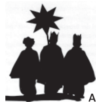
Aktion Dreikönigssingen 2011

Christus Mansionem Benedicat – Christus segne das Haus