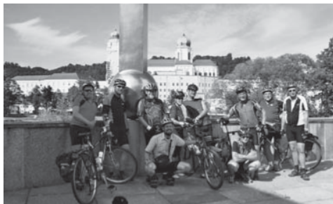
Alle Radler in Passau

Niederaltaich. Nun stand die Königs-etappe auf dem Programm: eine wahre Bergetappe nach Kostenz, zugegeben