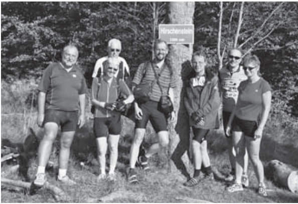
Auf dem Dach der Tour

So verband sich auf dieser Tour das Radfahren mit der Spiritualität der Klöster und unserem eigenen Glaubensleben.