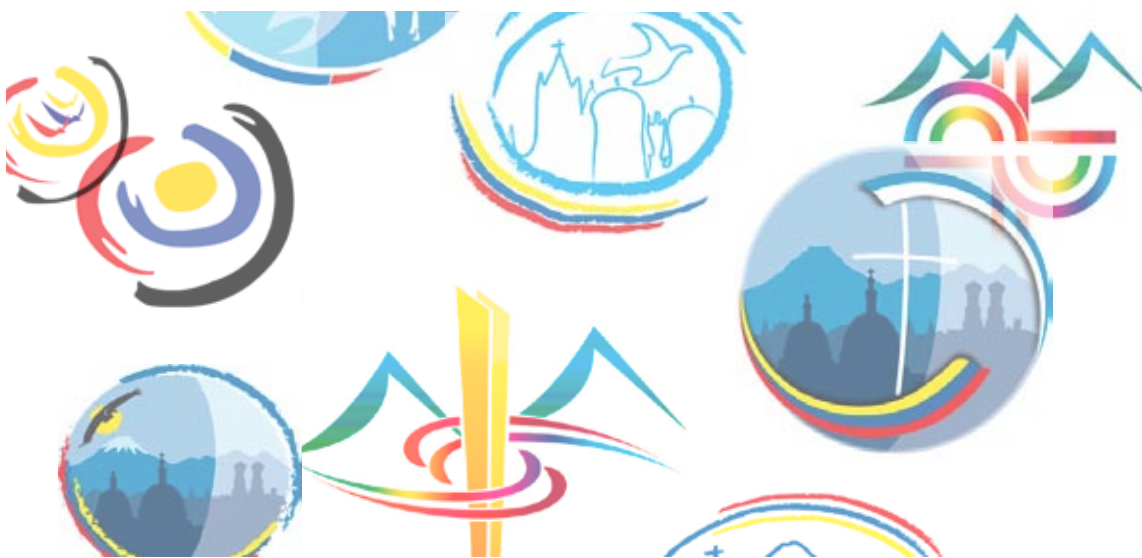
Grafiker aus München und Ecuador lieferten ihre Vorschläge zum Logo für die Partnerschaft ab.