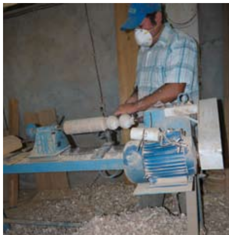
Aus dem Balsaholz werden die Kugeln gedreht. 10.000 sind in Auftrag gegeben!

Schon in diesem Jahr werden wir im Rahmen des Jubiläums mit einer Solidaritätsaktion zu Advent und Weihnachten einsteigen. Für Kindergärten, Grundschulen, Pfarreien und Verbände bieten wir die entwicklungspolitisch wertvolle Aktion „Weihnachten Weltweit“ an, bei der Balsaholzkugeln aus einem Schulprojekt in Puyo/Ecuador erworben und als Weihnachtskugeln gestaltet werden können. Im folgenden Artikel erfahren Sie mehr über das Projekt in Puyo.