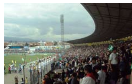
Abschluss der Jugendbegegnung im Stadion