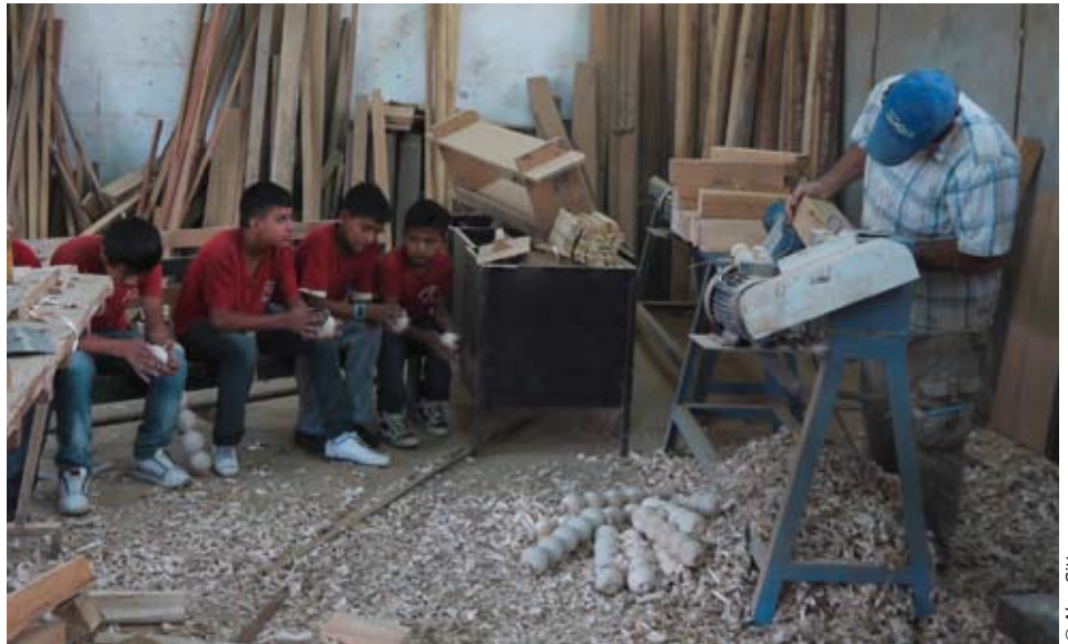
So entstehen die Kugeln aus Balsaholz. Da fliegen die Spähne!

Puyo ist die größte Stadt im Kanton Pastaza im ecuadorianischen Amazonien. Aufgrund der Umsiedlungen der Indígenas aus dem Regenwald und der