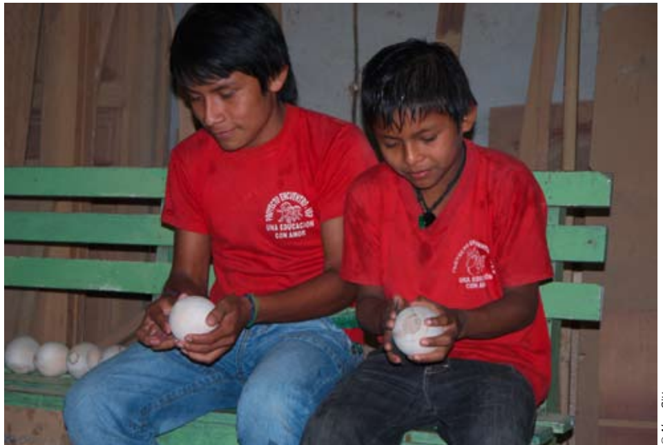
Die „Bombillas“ und Jugendlichen bekommen im Projekt „Encuentro“ in Puyo ihren Feinschliff!