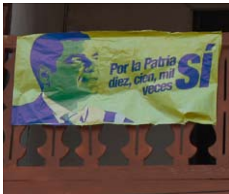
Mit diesen Plakaten wirbt Correa für die vorgeschlagenen Veränderungen im Referendum: „Ja - Für die Heimat - zehn, hundert, tausend Mal!“

Friedrich Ebert Stiftung, Oficina Ecuador