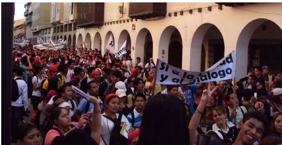
Jugendliche pilgern durch die Stadt Cuenca

Musikgruppen auf. Gekrönt wurde die Veranstaltung mit Einlagen aus unterschiedlichen Diözesen und Jugendbewegungen Ecuadors, die die vielfältige Kultur des Landes präsentierten. Unter anderem konnten die Zuschauer auch traditionelle Tänze der afro-ecuadorianischen und indigenen Kultur bestaunen. Gegen 20.00 Uhr verliessen die knapp 10.000 Personen den Coliseo und wurden mit einem Feuerwerk-Schauspiel verabschiedet.