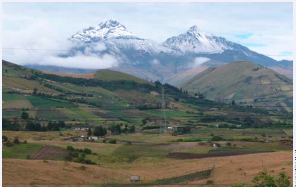
Wunderschöne Landschaft: die Vulkane Illiniza Sur und Illiniza Norte