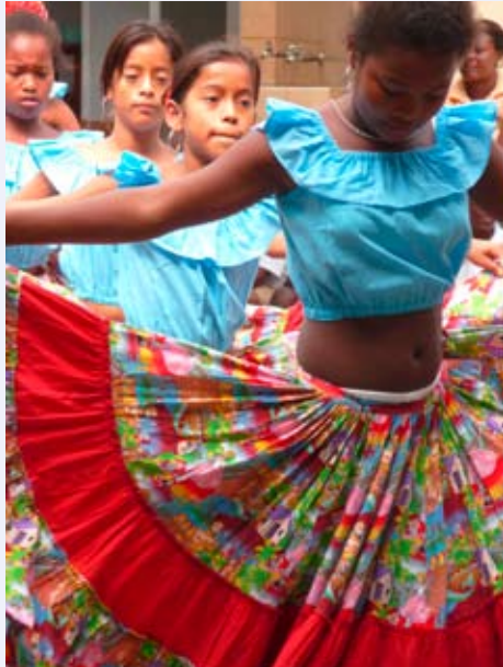
Ecuador meets Africa: Schülerinnen in Esmeraldas führen traditionellen Tanz auf

Schwerpunkt der Reise wird die Begegnung mit der Pastoral- und Sozialarbeit der Kirche Ecuadors sein. Das Land ist nicht nur landschaftlich sehr vielfältig, sondern auch seine Menschen und ihre Lebenssituationen. Indios, Afro-Ecuadorianer, Mestizen und Weiße haben je unterschiedliche Kulturen und Lebensweisen. Die Kirche versucht diese in