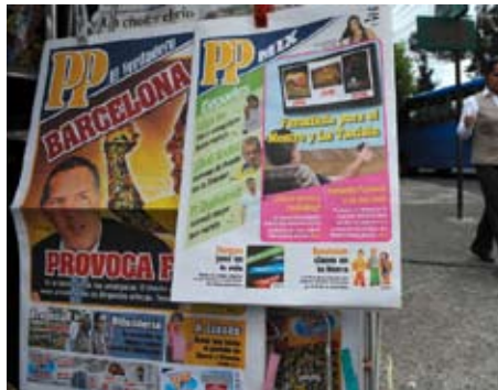
Die neue Zeitung mit dem zynischen Titel PP - El Verdadero