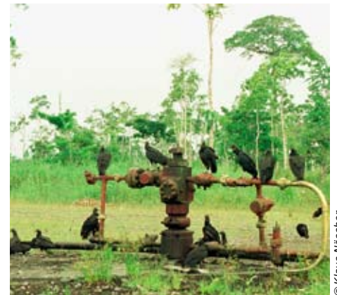
Symbolisch: Geier auf einer Erdölvorrichtung