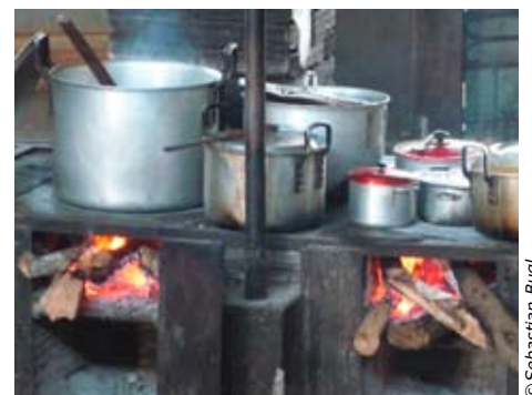
Das Schulessen wird oft mit einfachsten Mitteln gekocht