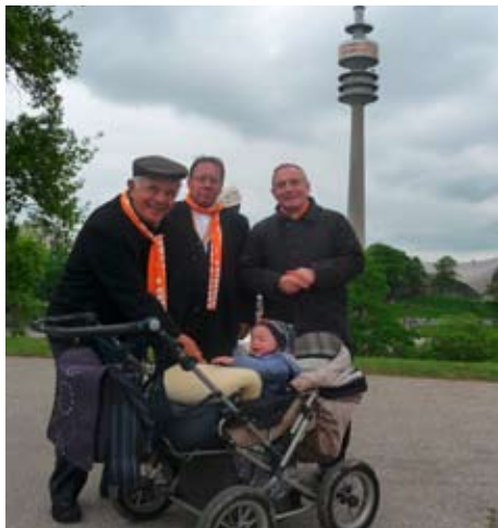
Bei der Besichtigung des Zentrums Jugend im Olympiapark hatten die Bischöfe ihren Spaß

Deutschland durch den Ökumene-Referenten der Erzdiözese Dr. Andreas Renz für alle Ecuador-Gäste hat einen ersten wichtigen Impuls zur Auseinandersetzung mit dem Thema gegeben. In Ecuador sei trotz Bemühungen die Annäherung der Kirchen schwieriger durch die Menge an evangelikalen Gruppen und Sekten.