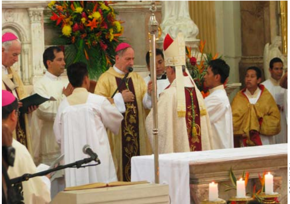
Zeremonie der feierlichen Einsetzung von Mons. Aníbal Nieto als erster Bischof der neuen Diözese