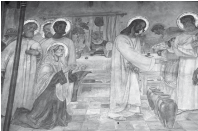
J. K. Becker-Gundahl Die Hochzeit zu Kana (Ausschnitt), 1908, Pfarrkirche St. Anna