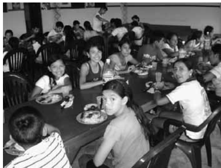
Jugendtreffen im Wellblechsaal

Pastoral. Außerhalb der Stadt betreuen wir ein Dorf mit Namen „Palmar“ (Palmenhain). Die ehemalige pfarrliche Schule ließ ich zu einem kleinen Jugendheim umbauen. In St. Anna hatten wir in meiner Zeit als Kaplan Götting! An einem Sonntag verbrachten hier in Palmar 70 Ministranten ihren Einkehrtag und Jugendtreffen. Neulich waren hier die 30 ehrenamtlichen Katecheteten der verschiedenen Firmgruppen. Auch organisierten die Jugendgruppen der verschiedenen Filialen eine „Olympiade“ mit Volleyball, Hallenfußball und Schach.