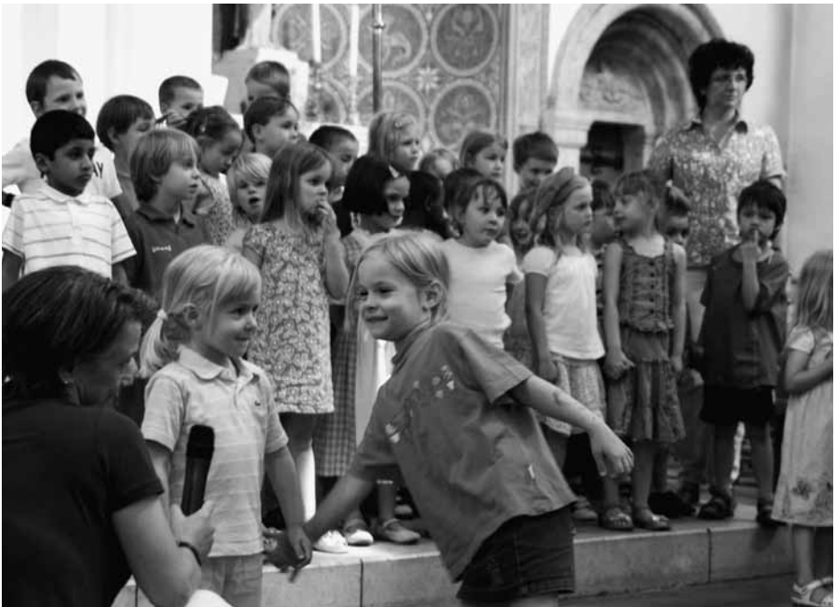
Kindergarten - Gottesdienst vor den Ferien