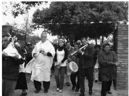
Einweihung des Pfarrheims in San Miguel

Bauten. Natürlich wollen wir keine "Baupastoral" betreiben! Doch wenn Kapellen einfach zu klein sind, wenn man Monate lang unter Bäumen zelebriert mit allen Risiken des tropischen Klimas ... dann muss man sich darum kümmern! Fünf Kapellen wurden erweitert. In einigen wurde