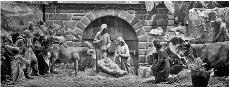
Die restaurierte Weihnachtskrippe in der Pfarrkirche. Allen Spendern ein herzliches Dankeschön!