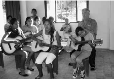
Gitarrenkurs für Kinder und Jugendliche

der- und Jugendgruppen. Ständig muss man dann Gruppenleiter suchen, ausbilden, begleiten.