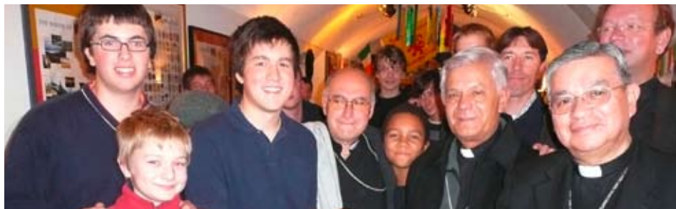
Bischöfe unter Jugendlichen auf den Spuren Benedikts XVI. hier im Studienseminar Traunstein