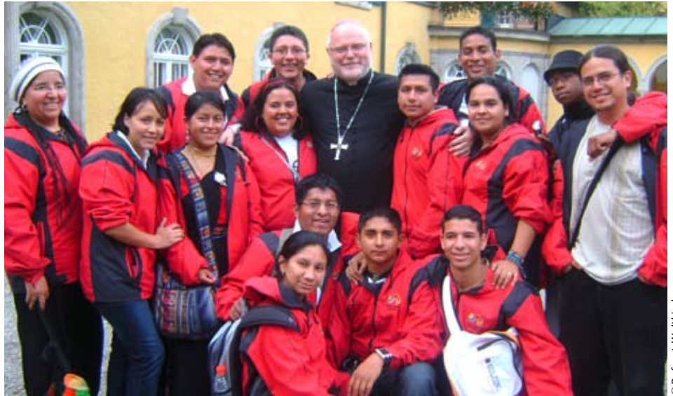
Die komplette Mannschaft der ecuadorianischen Jugenddelegation rückt mit Erzbischof Marx zusammen

15. Ecuador-Partnerschaftstreffen: Thema und Ort werden noch rechtzeitig bekannt gegeben.