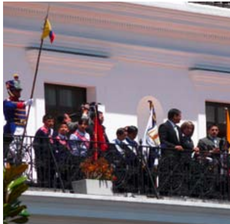
Präsident Correa, Dritter von rechts, auf dem Balkon seines Regierungssitzes in Quito

Im November kam eine staatliche Untersuchungskommission zu dem Ergebnis, dass mindestens 3,8 der gut 10 Milliarden US-Dollar Schulden Ecuadors illegal und unrechtmäßig entstanden seien. Grund für die Unregelmäßigkeiten seien überhöhte Zinsen, irreguläre Abschlüsse und nachträgliche Vertragsänderungen gewesen. Das sei als ein Resultat des Drucks durch internationale Banken und