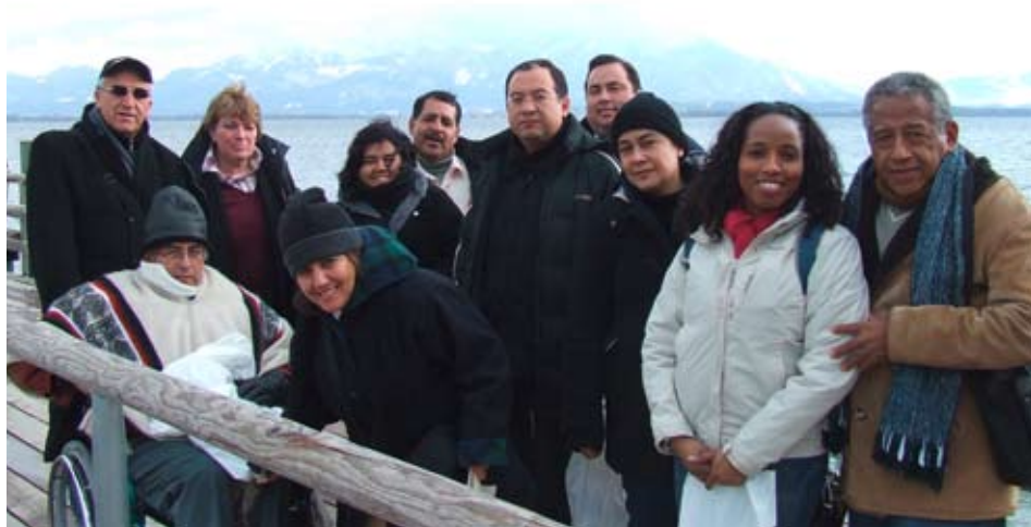
Rauer Wind am Chiemsee. Gruppenfoto CELCA vor bayrischer Kulisse.